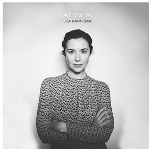
At Swin (2016)