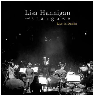
Live in Dublin (2019)