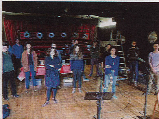
La Kreiz Breizh Akademi #8 lors de sa remise de diplôme dans la salle de bal de La Grande Boutique.

Au fil des ans, la KBA est devenue une pépinière de talents reconnue. « Ce n'est pas anodin si, à chaque promotion, DROM reçoit une centaine de dossiers pour une douzaine de sélectionnés », souligne Erik Marchand. « Les anciens stagiaires des formations précédentes sont musiciens pros dans le monde de la musique, en groupe ou collectifs, comme liés par le vocabulaire commun de la KBA ».