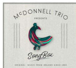
Song Box (2018) L'Autre Distribution