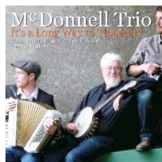
It's a long way to Tipperary (2014) L'Autre Distribution