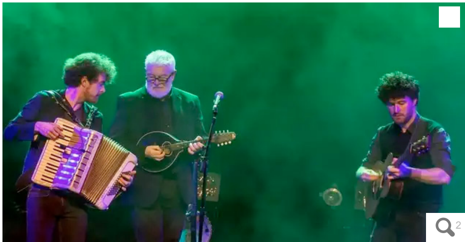
Le McDonnell trio ouvre la saison culturelle. © McDonnell trio

L'association Bouëxazik, avec le soutien de la municipalité et du conseil départemental, ouvre sa saison avec un concert du McDonnell trio.