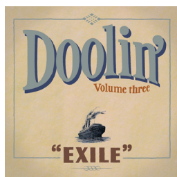
Exile Date de sortie : Juillet 2011