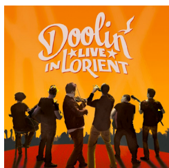
Livre in Lorient Date de sortie : Mars 2013