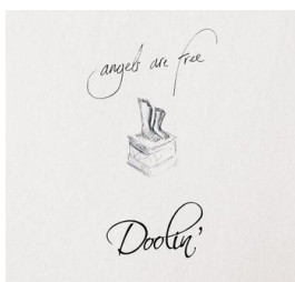
Angels are Free Date de sortie : Juin 2008