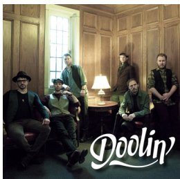
Doolin' Date de sortie : Juin 2016