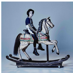
Circus Boy (Compass Records) Nouvel album à paraître en 2022