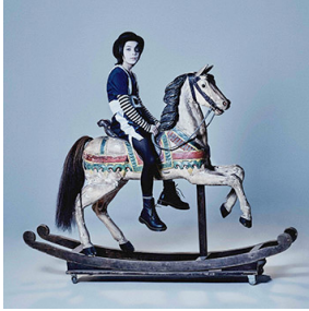
Circus Boy (Compass Records) Nouvel album à paraître en 2021