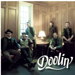
Doolin' Date de sortie : Juin 2016