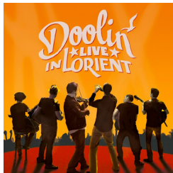
Livre in Lorient Date de sortie : Mars 2013