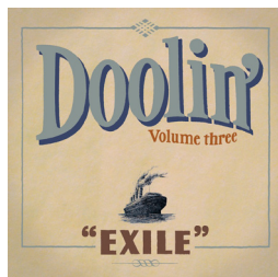
Exile Date de sortie : Juillet 2011