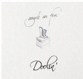
Angels are Free Date de sortie : Juin 2008